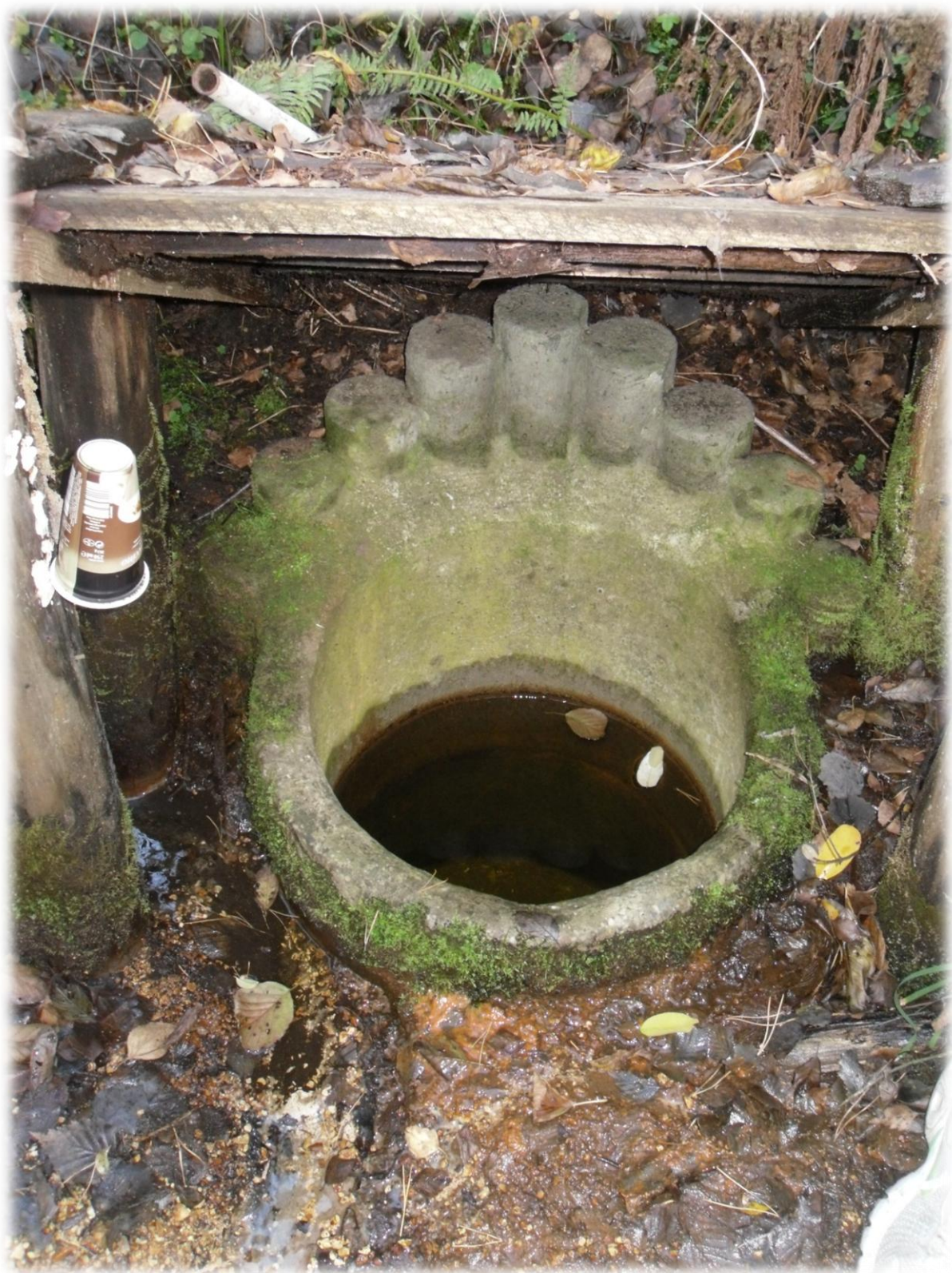
Fot.: 1 Źródło wody siarczanej w pełnej krasie.